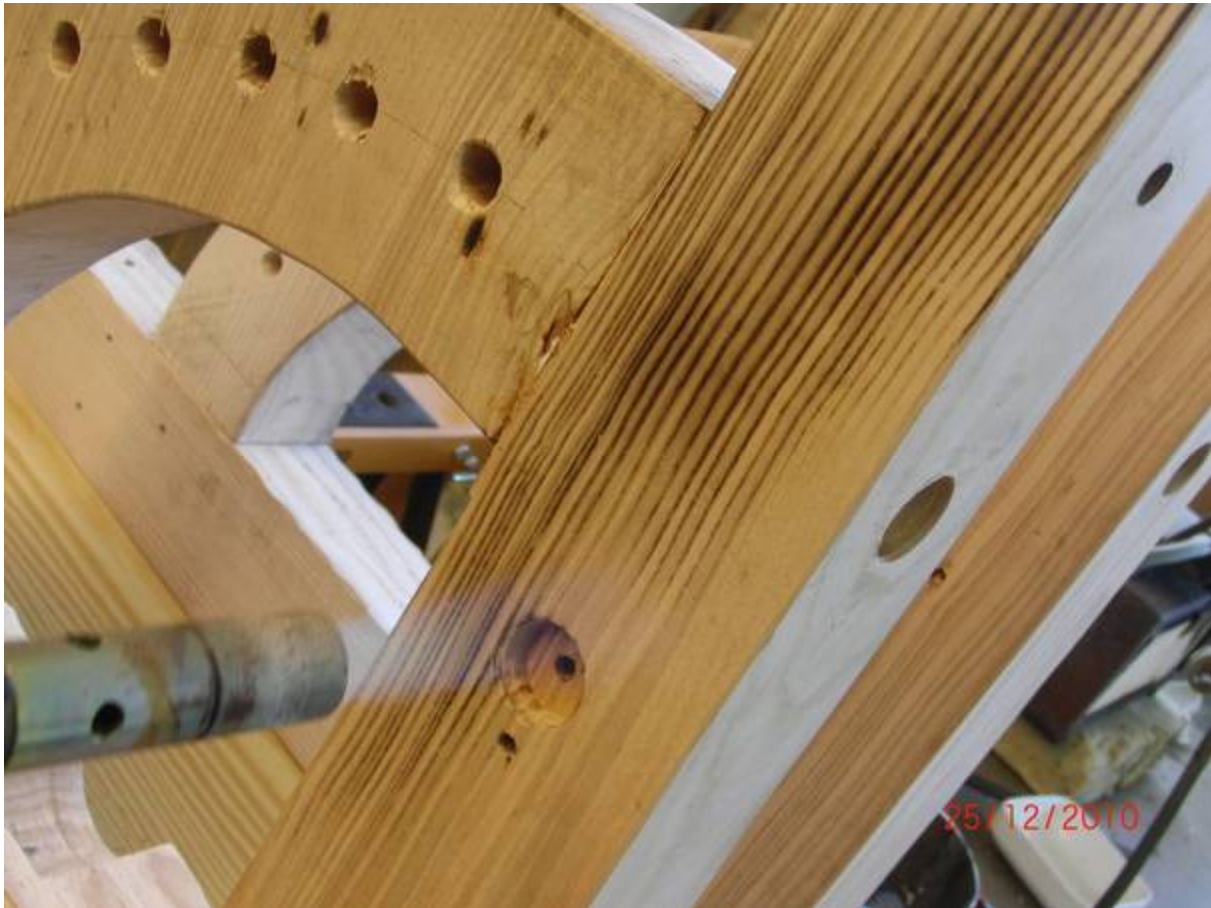
Flämmen des Holzes