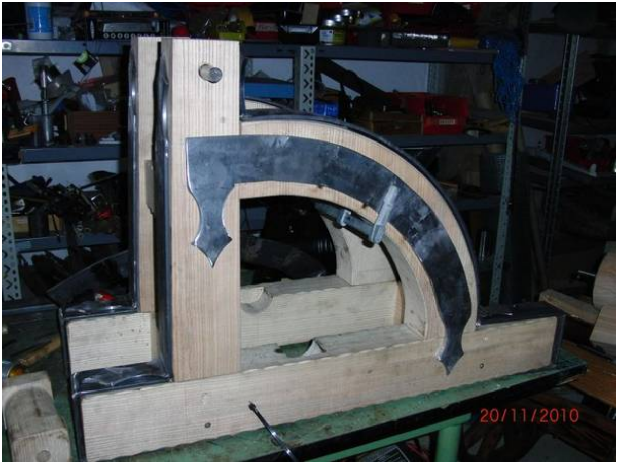
Anbringen der Verzierungen