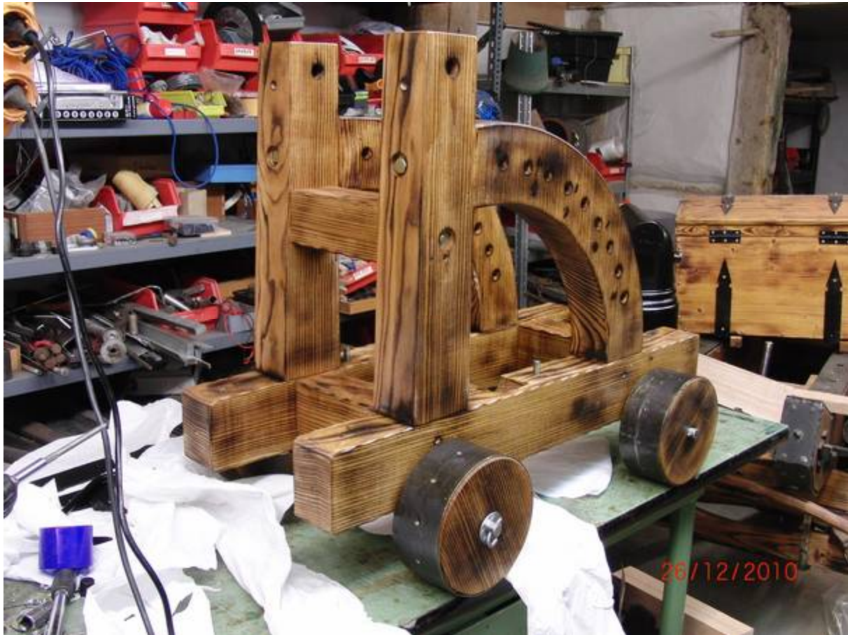
Anbringen der Achsen und Räder