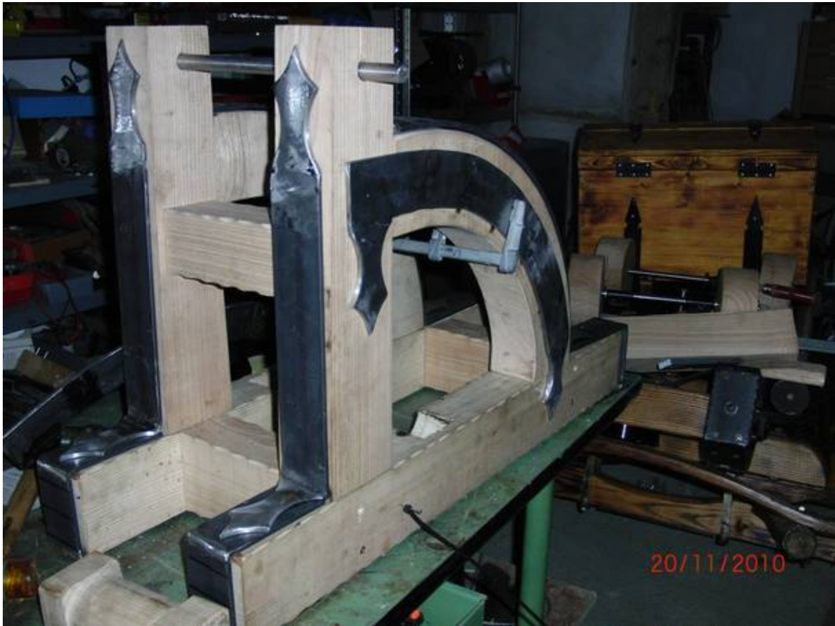
Einsetzen der Spindelachse