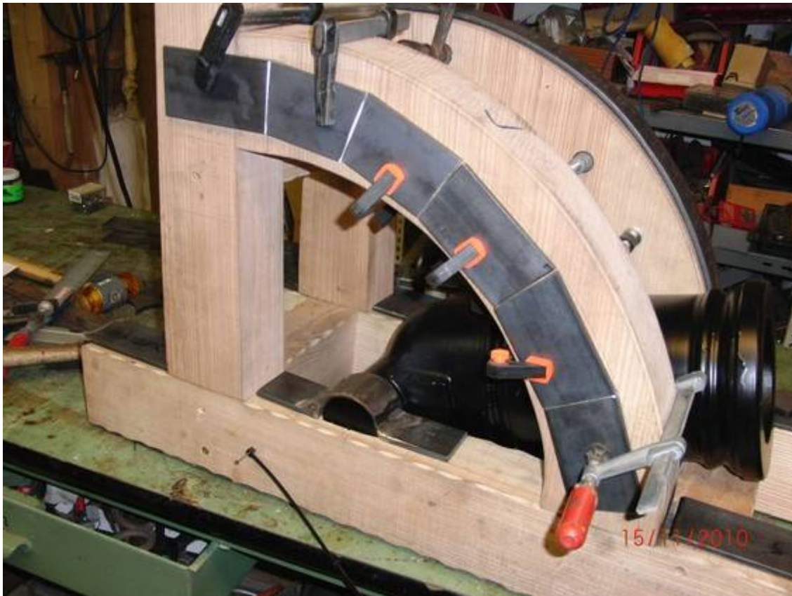
Anpassen der Metallteile Hier für den Richtbogen