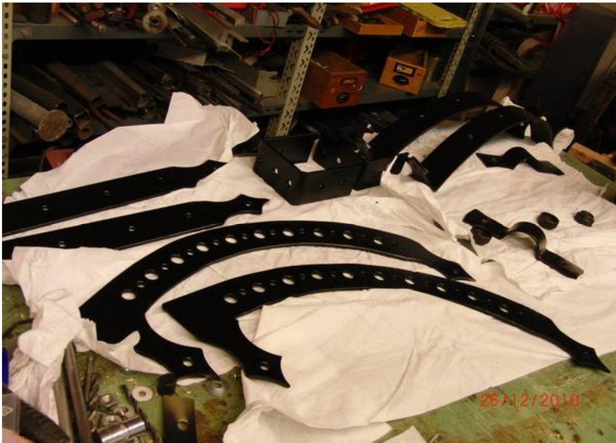
Alle Metallteile fertig lackiert